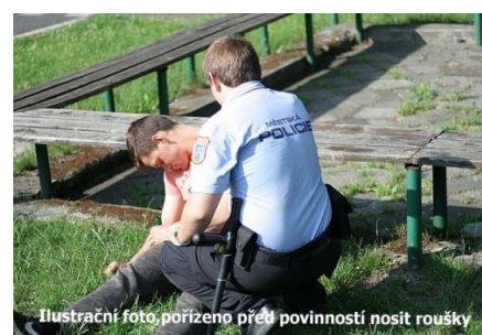
Ilustrační foto, pořízeno před povinností nosit roušky

zraněn, jevil však znaky silné podnapitosti, nebyl schopen samostatné chůze a s hlídkou nikterak nekomunikoval. Na místo přivolání záchranáři tohoto muže následně převezli k vyšetření do Fakultní nemocnice Ostrava. Přestupkové jednání bylo strážníky oznámeno příslušnému správnímu orgánu k projednání.