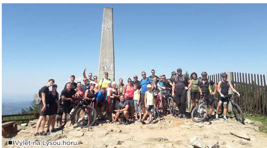
■ Výlet na Lysou horu

si dokonce mohli vybrat ze dvou způsobů, jak tuto královnu Moravskoslezských Beskyd zdolat, buďto šlapat 70 km do pedálů, nebo šlapat pěšky z Ostravice. Na vrcholu se