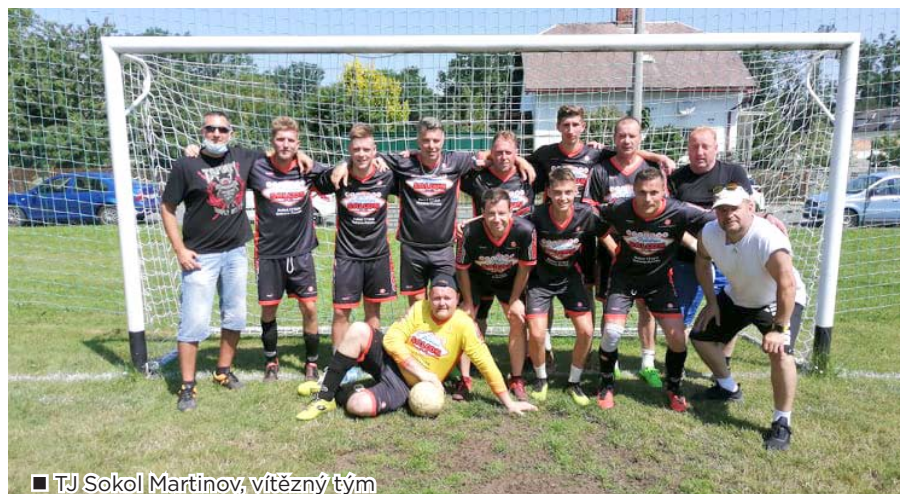
■ TJ Sokol Martinov, vítězný tým