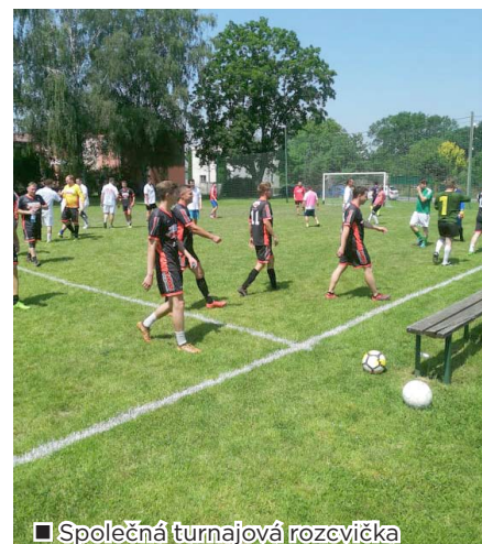
■ Společná turnajová rozsvička