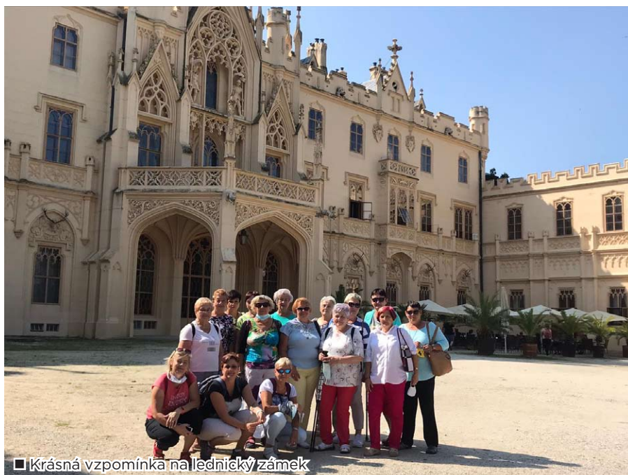
□ Krásná vzpomínka na lednický zámek

V době nouzového stavu a karantény jsme aktivně spolupracovali s oblastním spolkem ČČK Ostrava (a v současné době ještě spolupráce pokračuje) jednak při distribuci ušitých roušek, tak v oblasti nábory dobrovolníků (nejen z řad členů místní skupiny) do odběrových center.