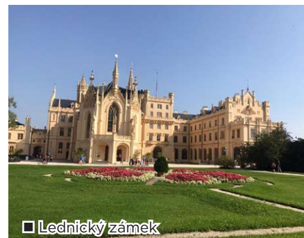
□ Lednický zámek