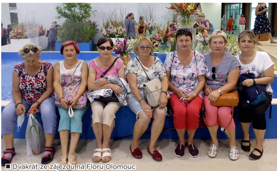
□ Dvůkrát ze zájezdu na Floru Olomouc