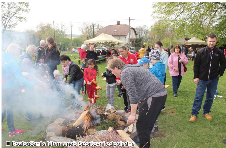
■ Rozloučení s létem aneb Sportovní odpoledne