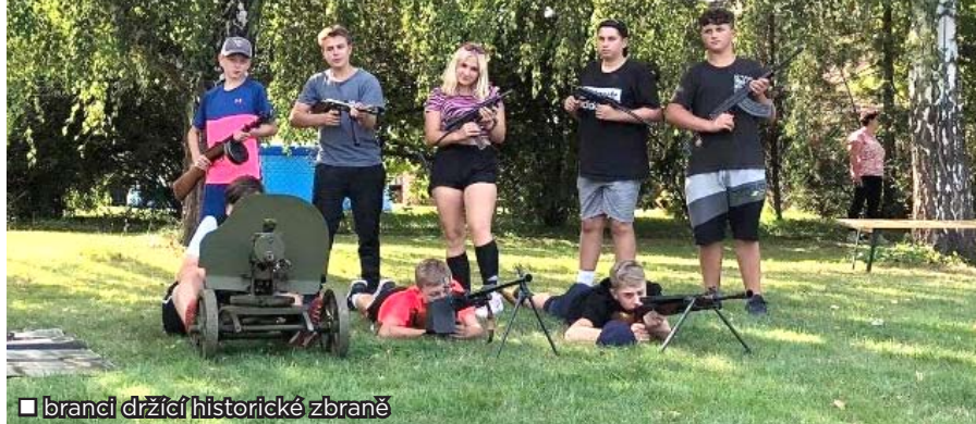
branci držící historické zbraně

Zvuky výstřelů, vybuchující miny, lasery, odpal raket, vzduchem létající šípky, křik, pot a krev – i takto by se dal popsat branný