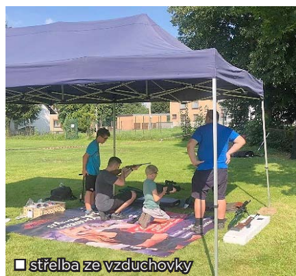
střelba ze vzduchovky