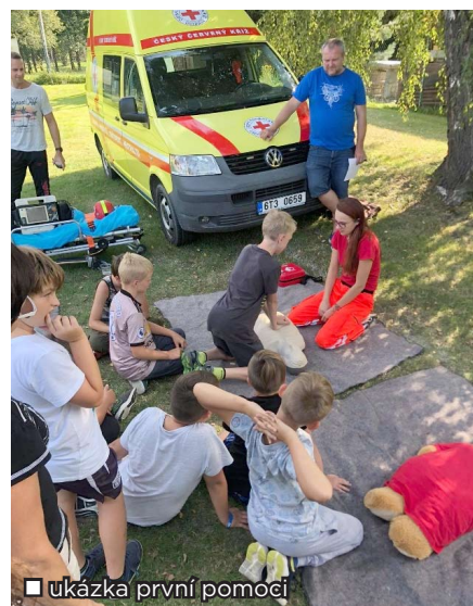
ukázka první pomoci